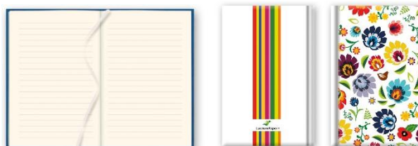
blok notesu / przykładowy tył i przód notesu